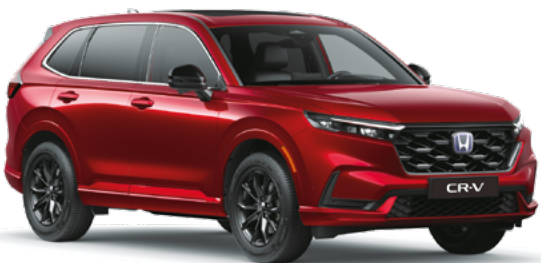
Premium Crystal Red Metallic