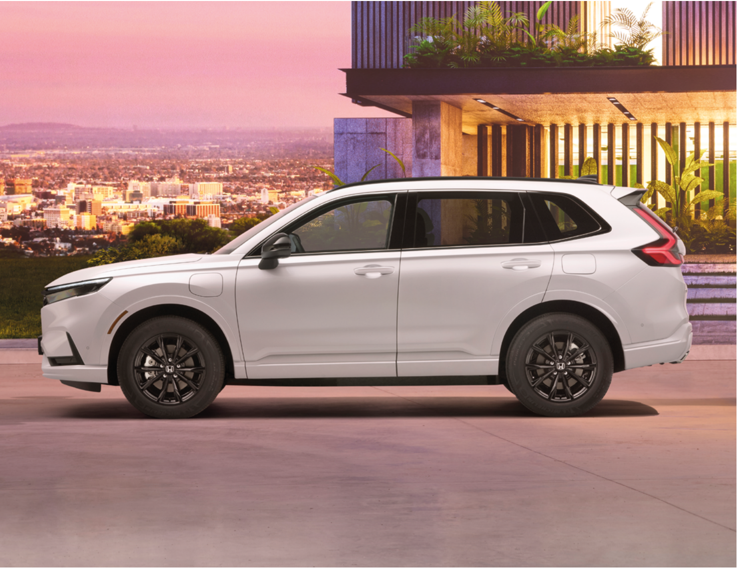
Uus Honda CR-V