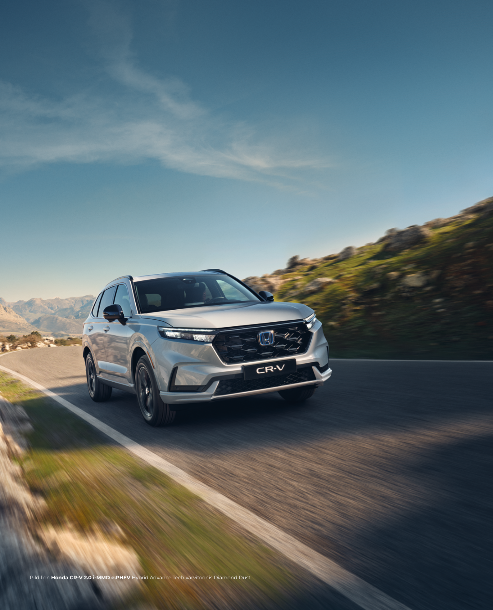
Pildil on Honda CR-V 2.0 i-MMD e:PHEV Hybrid Advance Tech värvitoonis Diamond Dust.