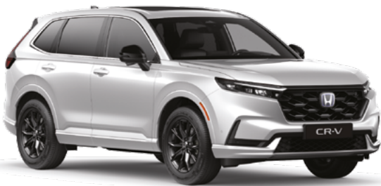
Platinum White Pearl