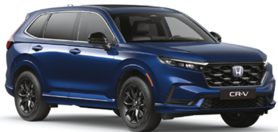
Canyon River Blue Metallic