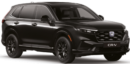
Crystal Black Pearl