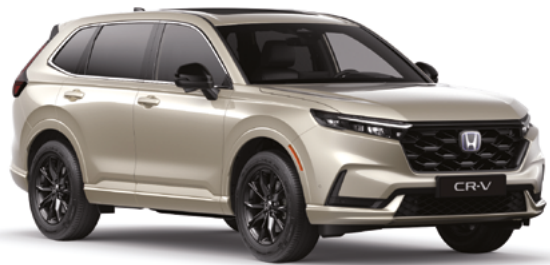
Gold Titan Metallic