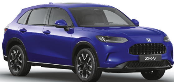
Still Night Pearl