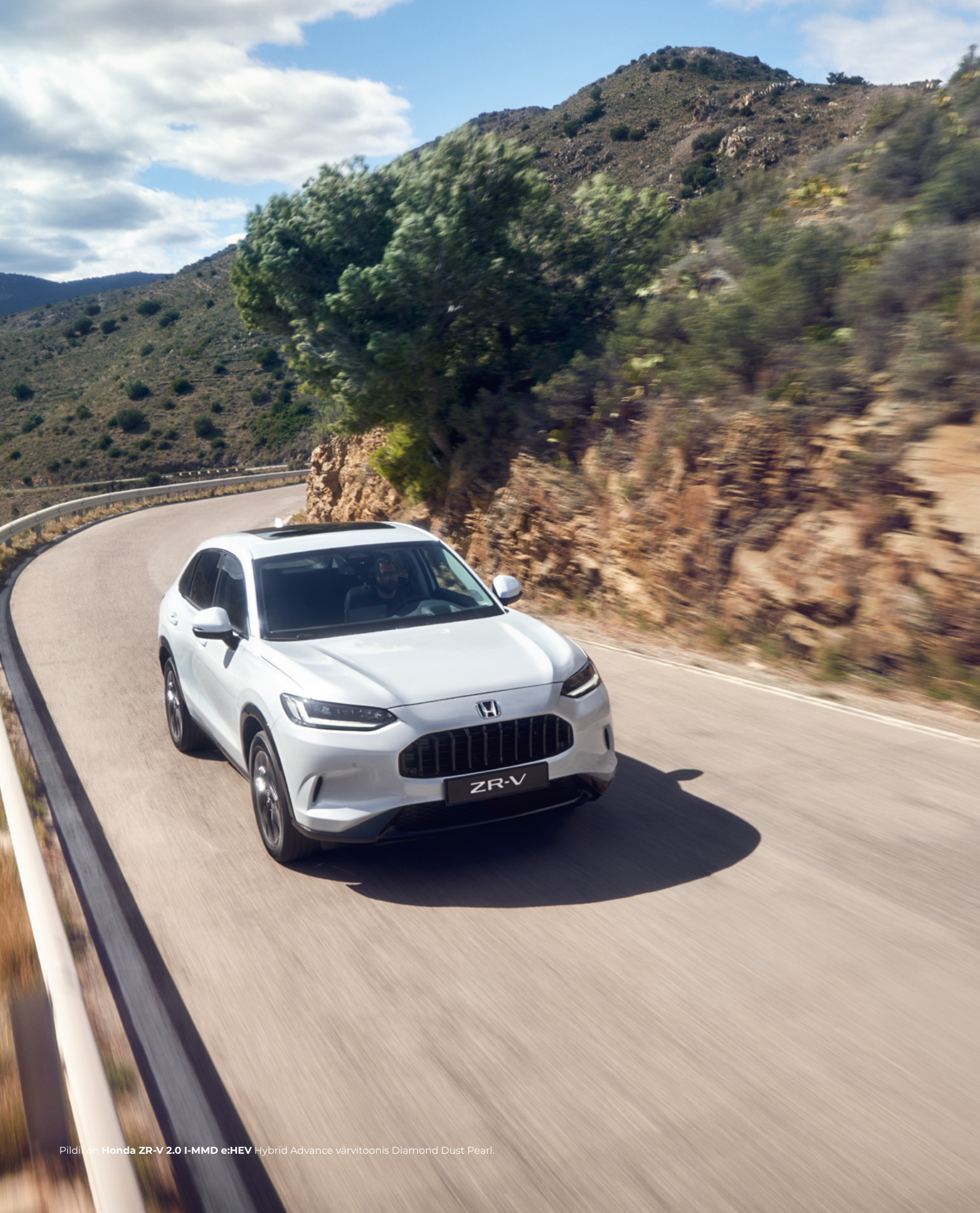
Pildid on Honda ZR-V 2.0 I-MMD e:HEV Hybrid Advance värvi toonis Diamond Dust Pearl.