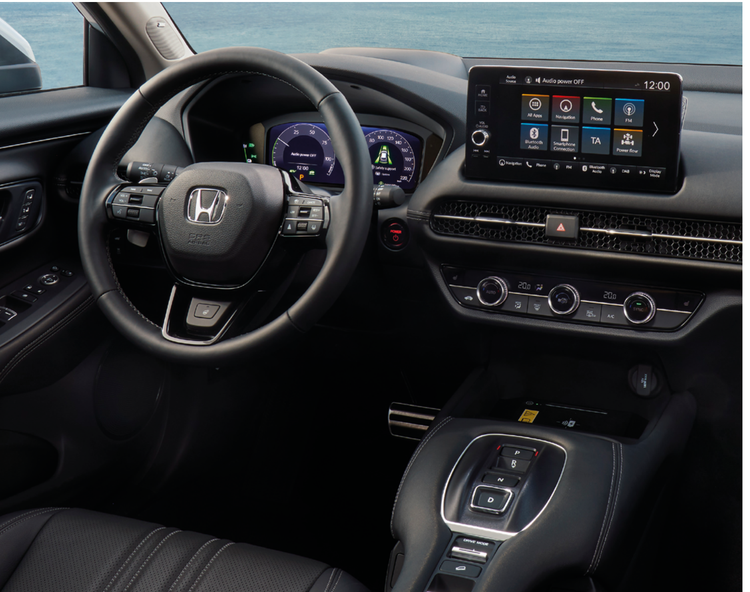
Uus Honda ZR-V e:HEV