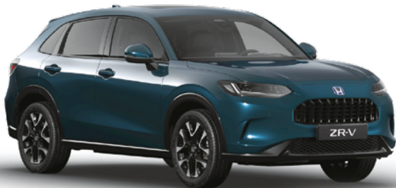
Nordic Forest Pearl