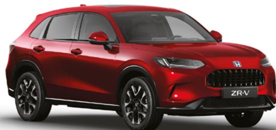
Radiant Red Metallic