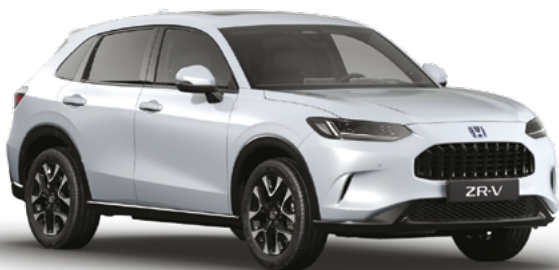
Diamond Dust Pearl