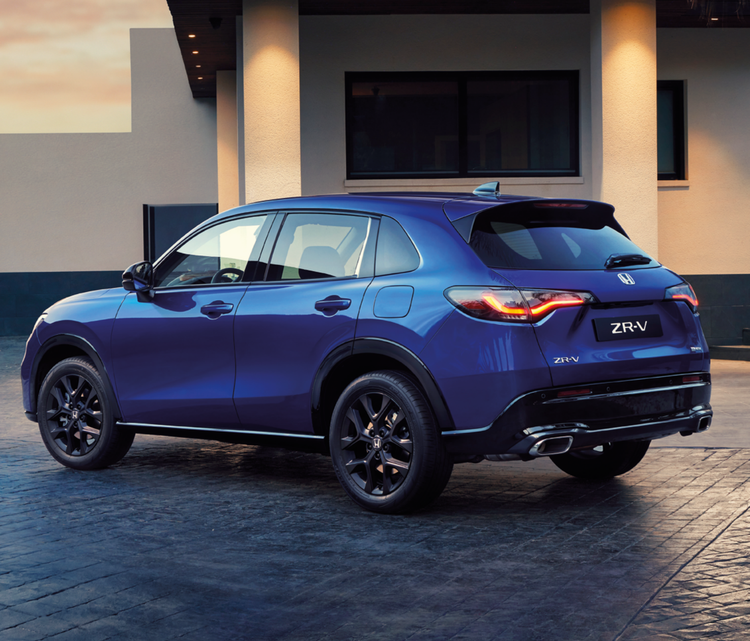
Uus Honda ZR-V e:HEV