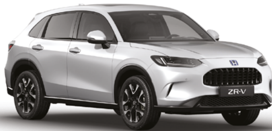
Platinum White Pearl