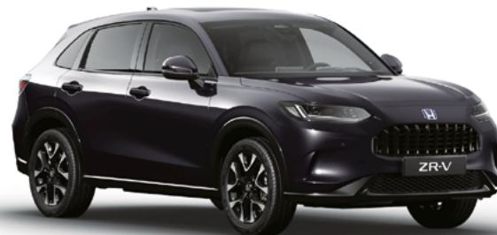
Ruse Black Metallic