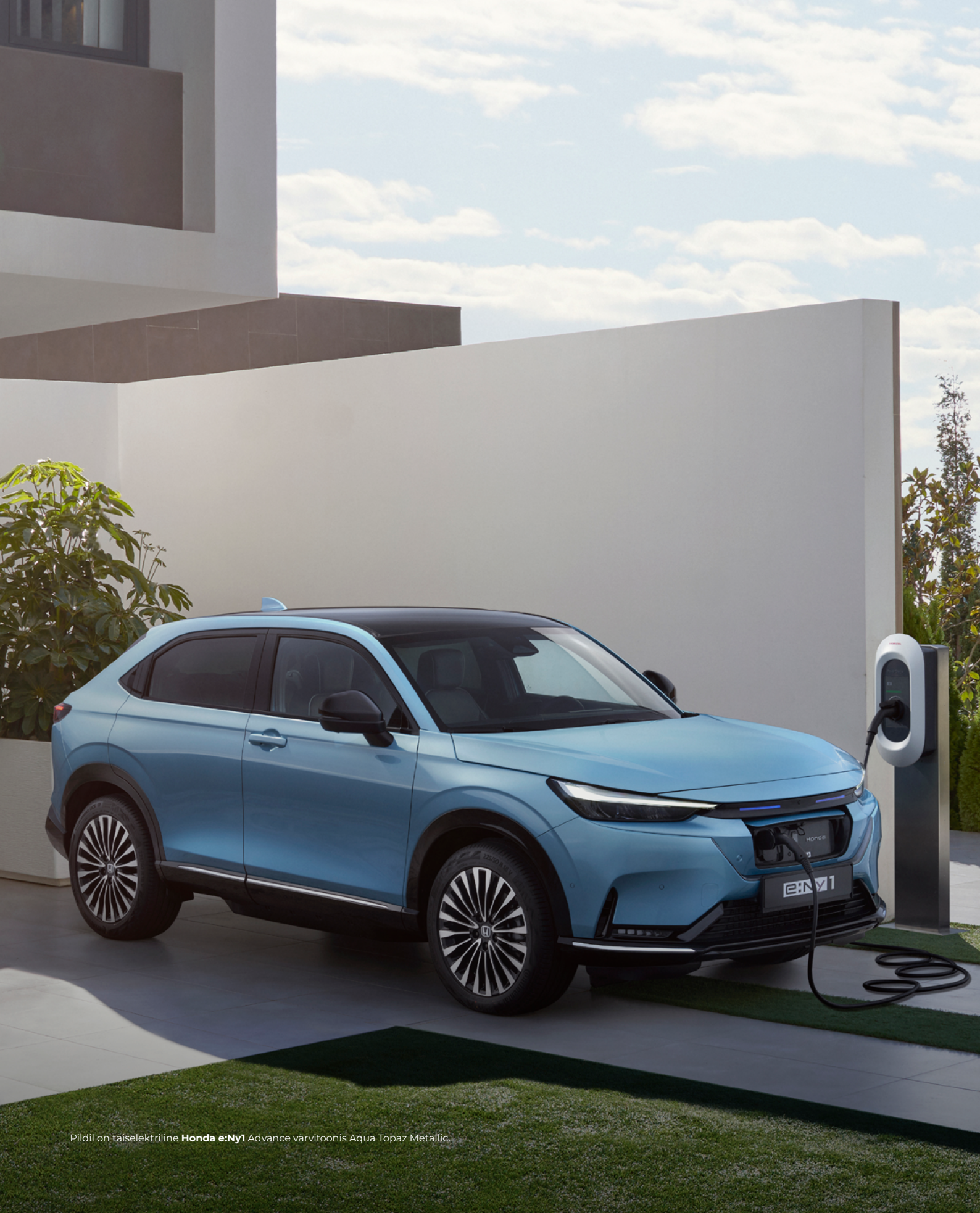
Pildil on täiselektriline Honda e:Ny1 Advance värvitoonis Aqua Topaz Metallic.