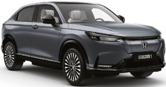
Urban Gray Pearl