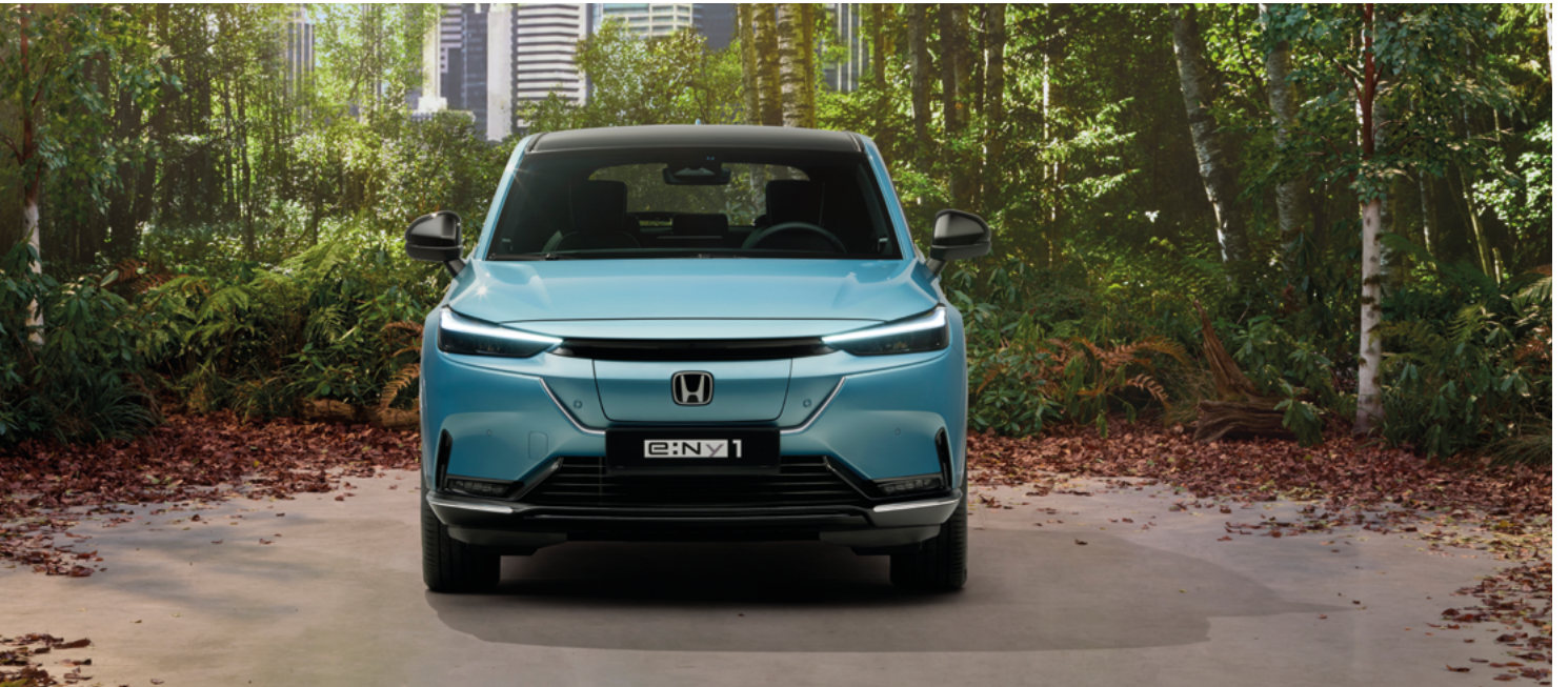
Uus Honda e:Ny1