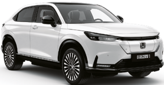
Platinum White Pearl