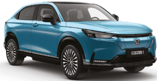
Aqua Topaz Metallic