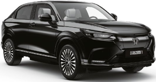
Crystal Black Pearl