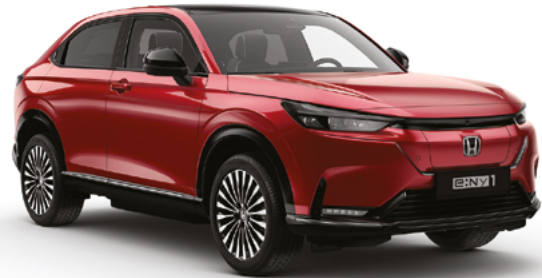
Vermilion Red Pearl