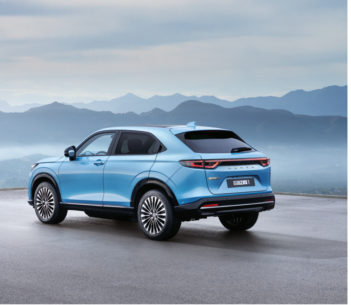
Uus Honda e:Ny1